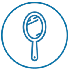
Conciencia de sí mismo