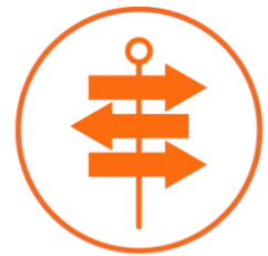
Toma de decisiones