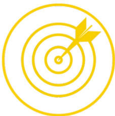
Comportamiento dirigido a objetivos