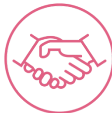
Habilidades de relación